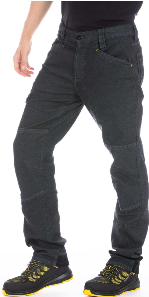
Ref. WELLER1 Gris

Pantalon technique réalisé en tissu résistant avec traitement enzymatique, qui donne au vêtement un aspect moderne et vécu sans compromettre la durabilité. Les coutures renforcées à 3 aiguilles et les bartaks jaunes contrastés aux points les plus sollicités garantissent résistance et durabilité même dans les activités les plus exigeantes, 79% coton, 19,5% polyester, 1,5% spin